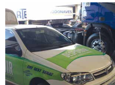
RTE Rodonaves, em São José dos Pinhais

DESPOLUIR PROGRAMA AMBIENTAL DO TRANSPORTE