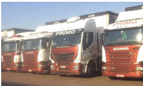
Transprimo, em Ponta Grossa