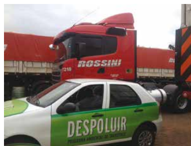
Rossini Transportes, em Maringá