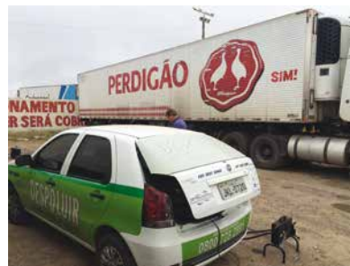
Rodoviário Monte Sereno, em São José dos Pinhais