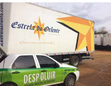
Estrela do Oriente, em Curitiba