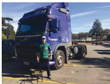
PepsiCo do Brasil, em Curitiba