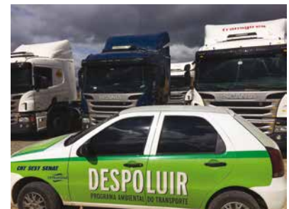
Transgires, em Curitiba