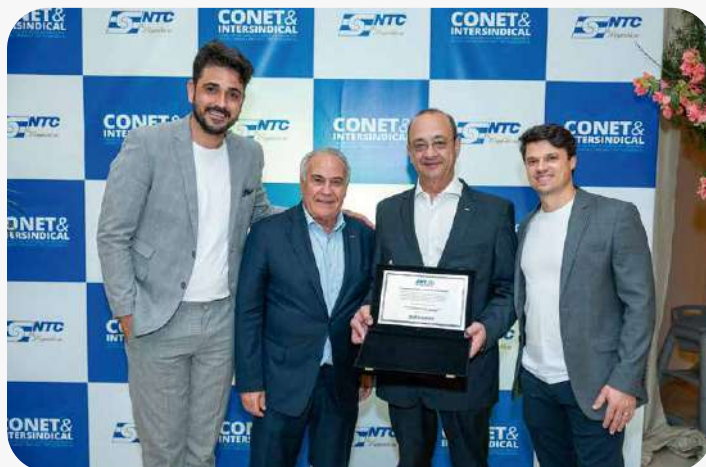
O evento, sediado em Itapema (SC), contou com a parceria da Fetransesc e apoio dos sindicatos que compõem a sua base