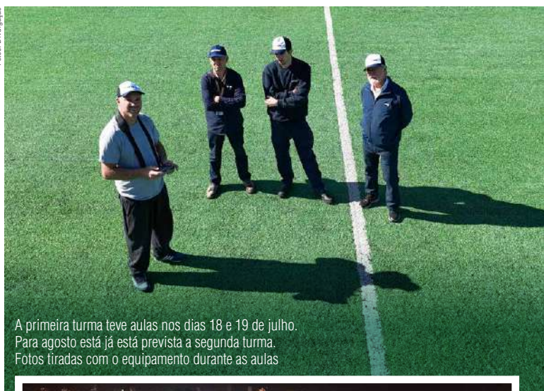
A primeira turma teve aulas nos dias 18 e 19 de julho. Para agosto está já está prevista a segunda turma. Fotos tiradas com o equipamento durante as aulas