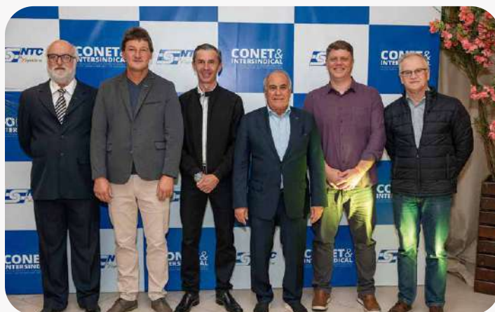
Nesta edição, o encontro voltou ao tradicional: CONET, voltado à discussão empresarial de custos e a Intersindical, com pautas relacionadas ao desenvolvimento das atividades do setor