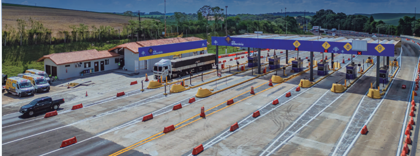
Concessionárias EPR Litoral Pioneiro e Via Araucária começaram as cobranças no dia 23 de março