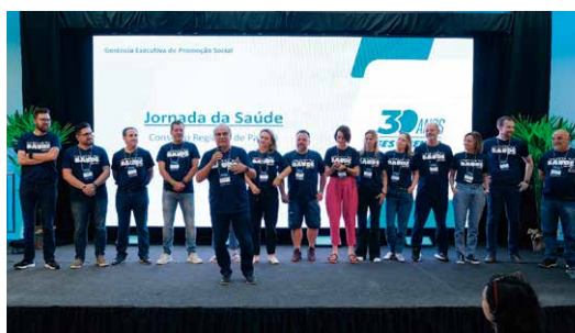
Além de motivacional, o objetivo da Jornada da Saúde é integrar os profissionais

O Sest Senat Paraná realizou entre os dias 8 e 11 de outubro a 1ª Jornada da Saúde, que reuniu cerca de 350 profissionais das 13 unidades do Estado. O evento contou com a participação de