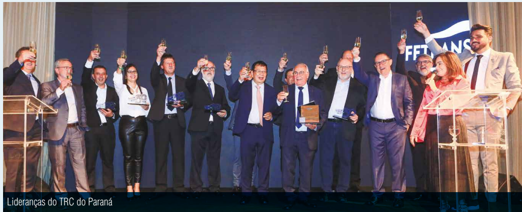
Lideranças do TRC do Paraná