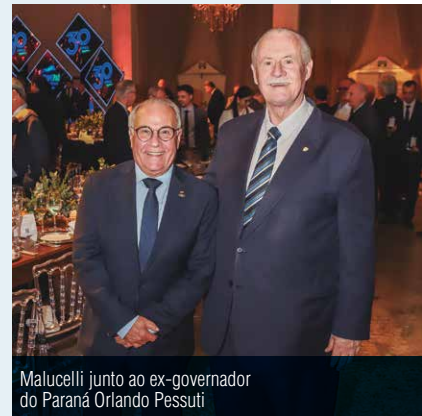
Malucelli junto ao ex-governador do Paraná Orlando Pessuti