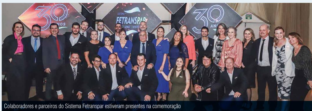
Colaboradores e parceiros do Sistema Fetranspar estiveram presentes na comemoração