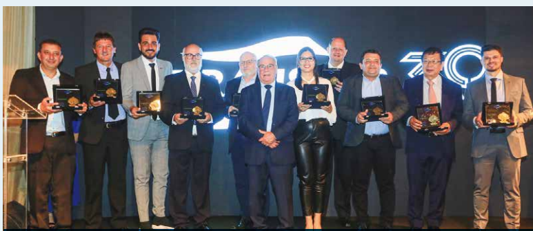
Todos os sindicatos e presidentes que fazem parte do Sistema Fetranspar foram homenageados durante o evento