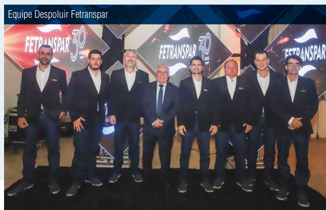
Equipe Despoluir Fetranspar