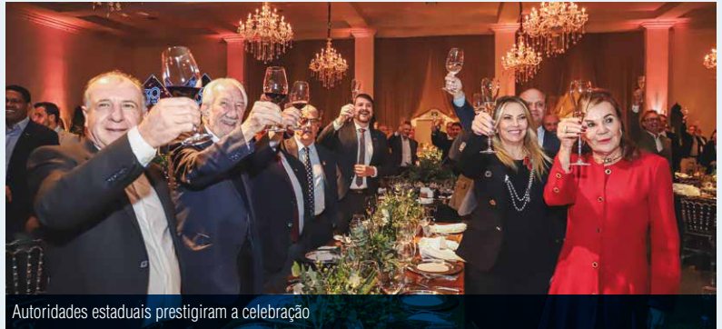
Autoridades estaduais prestigiam a celebração