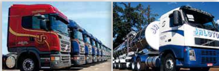
A ISO 39001 trata-se de um Sistema de Gestão de Segurança do Tráfego Rodoviário

As empresas de Maringá Jaloto Transportes e a Transpanorama são as únicas empresas brasileiras a conquistarem a Certificação ISO 39001.