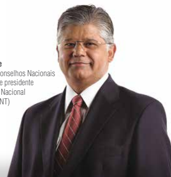
Clésio Andrade Presidente dos Conselhos Nacionais do SEST SENAT e presidente da Confederação Nacional do Transporte (CNT)

Nossa meta é contribuir cada vez mais para o crescimento e a valorização dos trabalhadores do transporte. É com mais qualidade e produtividade que vamos fazer o Brasil crescer. O Transporte move o Brasil e o SEST SENAT dá mais impulso a esse movimento.