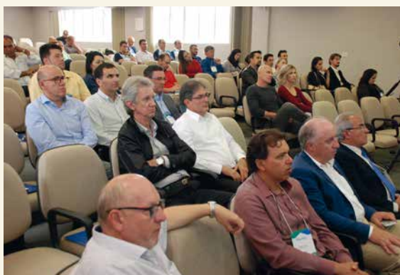
O encontro em março foi realizado no Setcepar